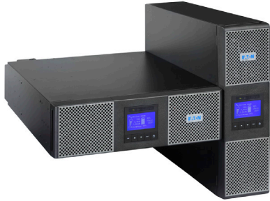
機架式、直立式可互換