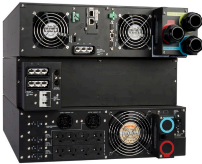
9PX 11kVA 帶輸出變壓器